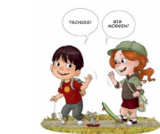
Wir verabschieden uns!