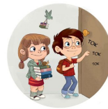
Wir klopfen an!