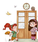
Wir sind pünktlich!

Hausaufgaben dienen grundsätzlich dem Festigen von Gelerntem. Der tägliche Aufwand für Hausaufgaben muss den persönlichen Möglichkeiten des Schülers / der Schülerin entsprechen. An schulfreien Tagen, Feiertagen und Nachmittagsunterricht während des Schuljahres wird keine Hausaufgabe gegeben.