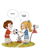
BITTE und DANKE sagen